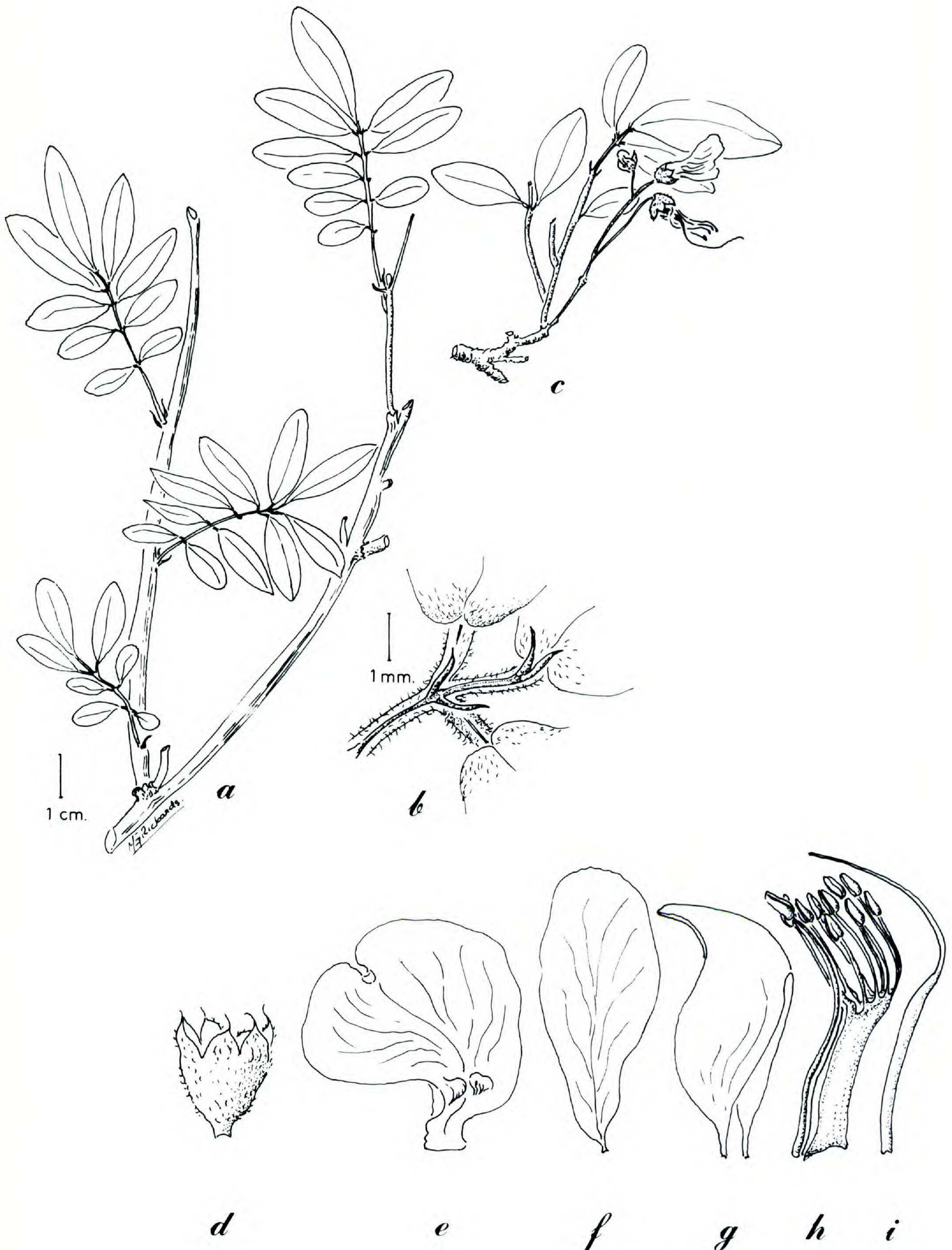
FIGURE 5. Coursetia apantensis .—a. Rama vegetativa.—b. Estipelas y pulvínulos.—c. Rama con inflorescencia.—d. Cáliz.—e. Estandarte.—f. Ala.—g. Quilla.—h. Androceo diadelfo.—i. Gineceo. Tomado de Moreno 175 .